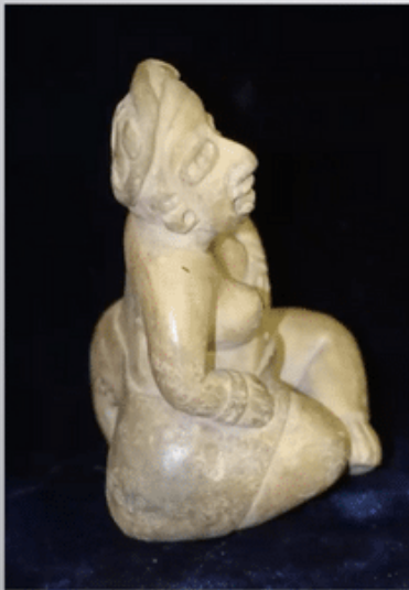
Ceramic figurine, 900-700 BCE Choloma, Honduras

It was an enlightening talk, emphasizing the importance of “...exploring ways to move beyond counting sexes or genders and accounting for such pre-existing essences, to promote ways of thinking, talking, and writing that allows for embodied experiences to be emergent phenomena that dynamically produce relationships we recognize today as identities.” After the keynote talk, the lively Q&A session has aptly shown the growing interest in gender archaeology, and the need for in-depth discussions on this topic.